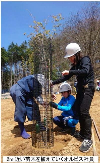
2m近い苗木を植えていくオルビス社員

オルビスは1987年の創業以来、常に事業活動における地球環境への負荷を意識し、環境に配慮した商品開発、サービスを心がけています。また2001年には社内に環境委員会を設置、2002年より現在まで継続して山梨県における社員参加型の環境ボランティアイベントを年2回、開催しています。