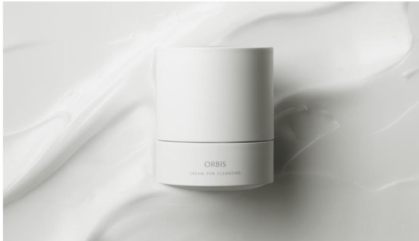
『オルビス オフクリーム』100g 2,300円（税込 2,530円）

オルビス株式会社（本社：東京都品川区、社長：小林琢磨）は、オルビスユー、オルビス ディフェンセラに続くオルビスの第3の象徴商品となる「オルビス オフクリーム」を2020年2月21日（金）に発売いたします。