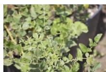
カンゾウ根エキス

■カンゾウ根エキス（保湿成分） 独特の甘みがあることから カンゾウ（甘草）と呼ばれている。 そのカンゾウの根から抽出したエキス。