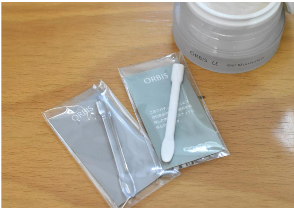
写真右：本取り組みによって、化粧品ボトルの原料を利用した再生プラスチックの「スパチュラ（ヘラ）」（白） 写真左：従来からの「スパチュラ（ヘラ）」（透明）

2023年1月より体験特化型施設『SKINCARE LOUNGE BY ORBIS』にて回収を開始した本取り組みにおいて、約18,000本のスパチュラの生産実現に至りました。