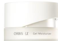
オルビスユー ジェルモイスタライザー 50g 3,000 円 (税込 3,300 円)