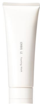
オルビスユー フォーミングウォッシュ 120g 1,800 円 (税込 1,980 円)